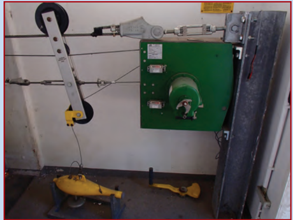
Pegel Bonnstraße; Meßeinrichtung; Aufnahme vom 18. Juli 2013