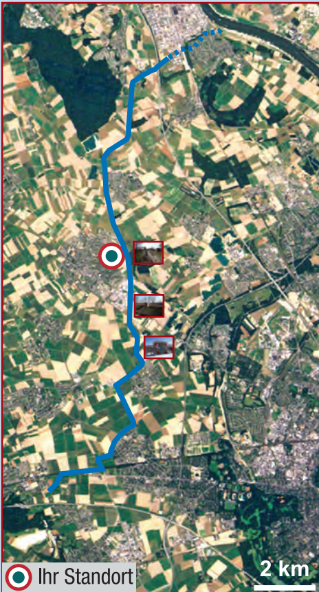
Satellitenbild Landsat 5 und 7 pan

Wichtige Planungsgrundlagen für ein zuverlässiges Wassermanagement sind Messungen von Wasserständen. Am Randkanal sind mehrere Messpegel eingerichtet, drei davon in einem Pegelhäuschen. Gemessen werden die Höhe des Wasserspiegels und im Bedarfsfall die Fließgeschwindigkeit (siehe alte Messeinrichtung im Bild oben). Daraus lassen sich die Wassermengen berechnen, die durch den Kanal strömen.