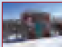
Pegel nördlich Lövenich